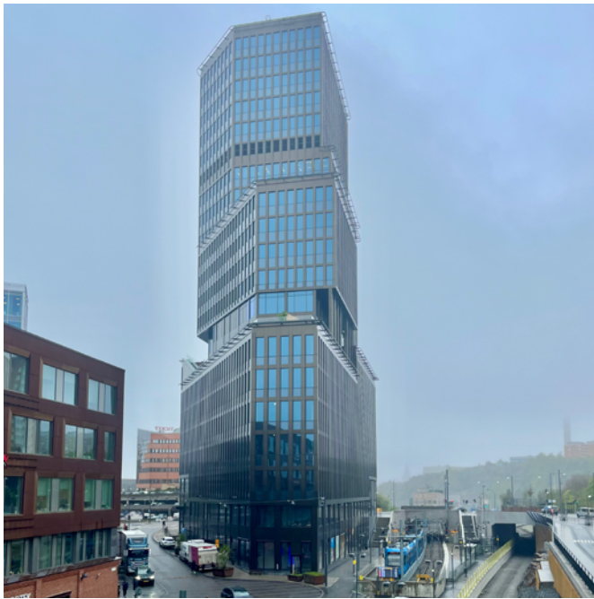
Byggnaden står på en 1500 kvadratmeter trekantig tomt, inpassad mellan spåren och Sickla affärskvarter.