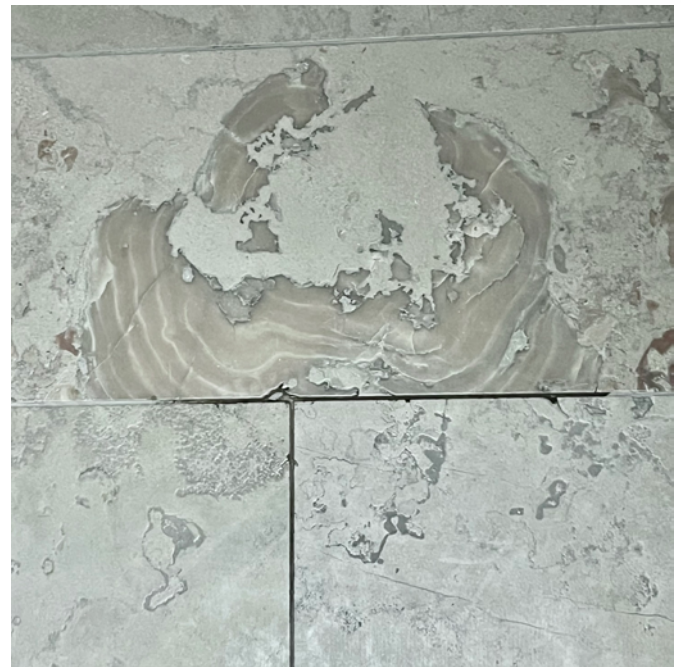
Äkta avtryck. På samtliga allmänna ytor ligger antikborstad Norrvange-kalksten.

– Aktörerna arbetar med massvis med parametrar som vi ska