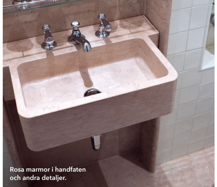
Rosa marmor i handfaten och andra detaljer.

Stenleverantör: Thorsbergs stenhuggeri och Borghamnstén