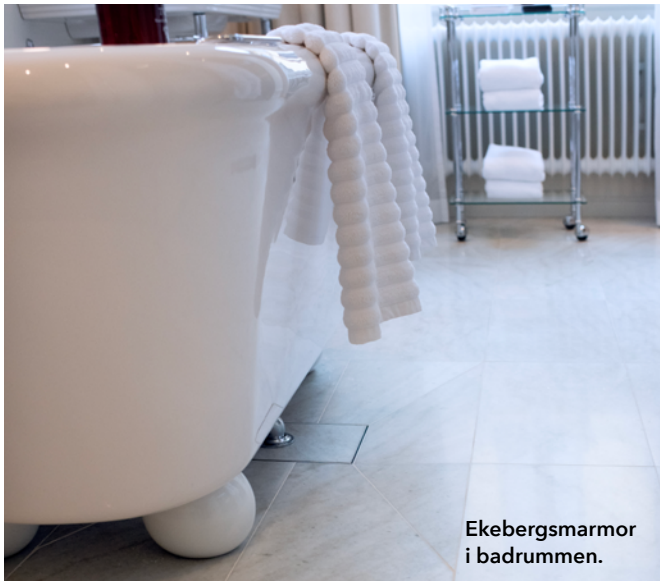
Ekebergsmarmor i badrummen.