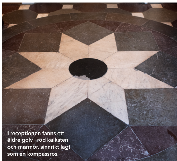
I receptionen fanns ett äldre golv i röd kalksten och marmor, sinnrikt lagt som en kompassros.