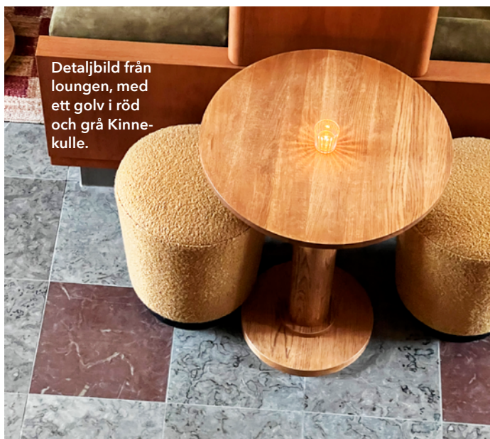
Detaljbild från loungen, med ett golv i röd och grå Kinnekulle.