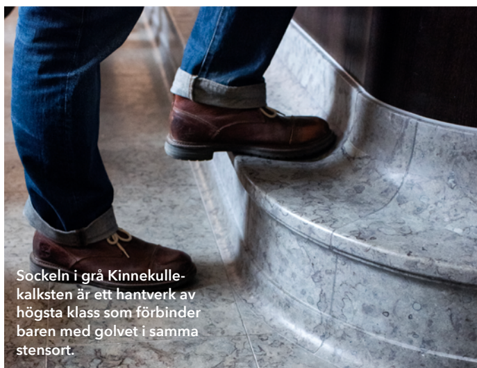
Sockeln i grå Kinnekulle-kalksten är ett hantverk av högsta klass som förbinder baren med golvet i samma stensort.