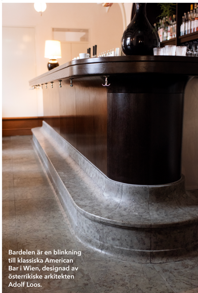
Bardelen är en blinkning till klassiska American Bar i Wien, designad av österrikiske arkitekten Adolf Loos.