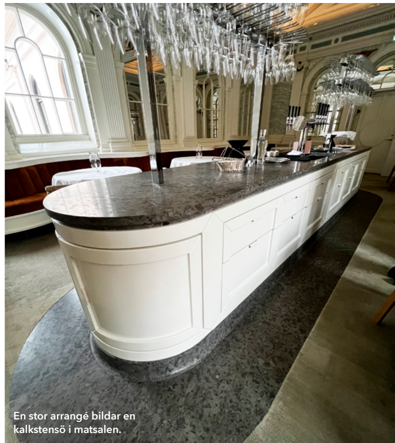
En stor arrangé bildar en kalkstensö i matsalen.