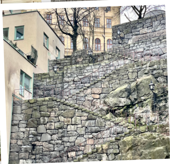
Förebilden: Harald Lindbergs trappor zig-zagar sig 119 steg uppåt Klevgränd!

S ommaren 2024 invigdes Vattentorget. Ett obegripligt byggtassel hade plötsligt försvunnit och istället öppnade sig ett nytt torg som snabbt blev en plats att tycka om och vara på. Alla kunde samsas: turister, stockholmare, cyklister och flanörer. De generösa bänkarna blev mötesplatser. Slussen blev en mänsklig installation, fylld av vänlig sten i kajkanter och gradänger vid Munkbrokajen mot Gamla stan. En stad är känslor och minnen och platsen fick en ny själ.