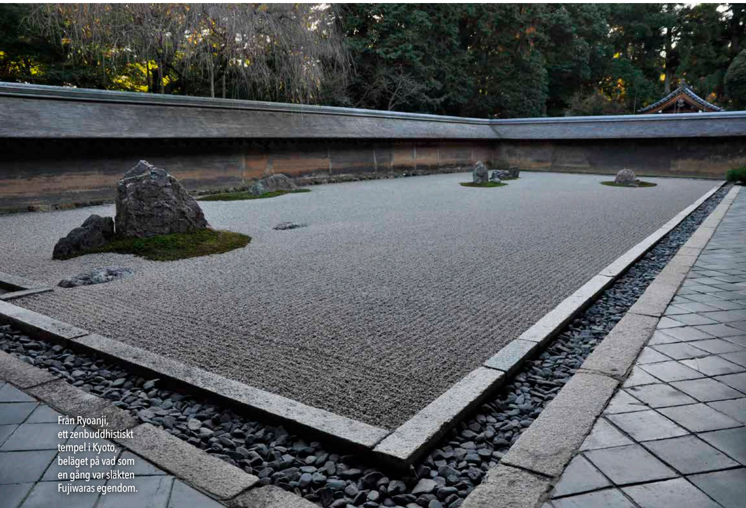
Från Ryoanji, ett zenbuddhistiskt tempel i Kyoto, beläget på vad som en gång var släkten Fujiwaras egendom.