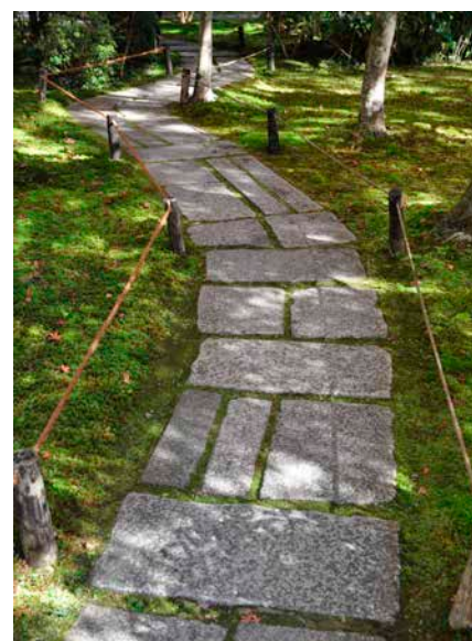
Saihoji är en av de mest kända japanska mossträdgårdarna, belägen i Kyoto. Sedan 1994 ett av Unescos världsarv.

De japanska trädgårdarna utgör ett av landets främsta bidrag till kulturhistorien. På de flesta sätt ligger dess uttryck och innehåll långt ifrån vår egen tradition men det finns också flera beröringspunkter. För landskapsarkitekturen kan många av de japanska principerna användas i gestaltning av en park eller trädgård även hos oss. Det kan resultera i något som engagerar på ett djupare sätt än vad vi ser med ögonen. ■