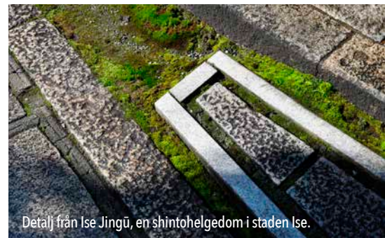
Detalj från Ise Jingū, en shintohelgedom i staden Ise.

ett zentempel. Det sätt som stenarna är placerade på följer ofta principen om formell, halv-formell och informell. Det gäller stenarnas form och relation men också deras karaktär; storlek, yta, färg. Även växtmaterialet i klippt, format och friväxande former använder tekniken med shin-gyo-so .