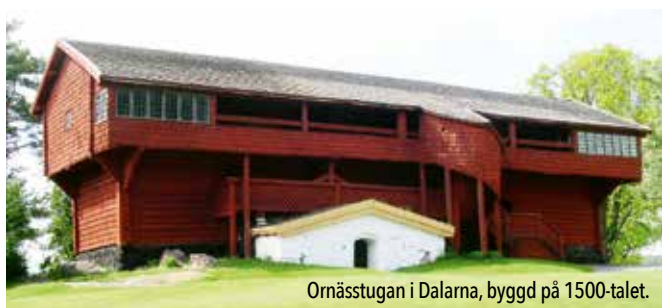
Ornsåstugan i Dalarna, byggd på 1500-talet.