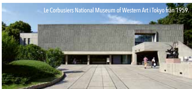
Le Corbusiers National Museum of Western Art i Tokyo från 1959.