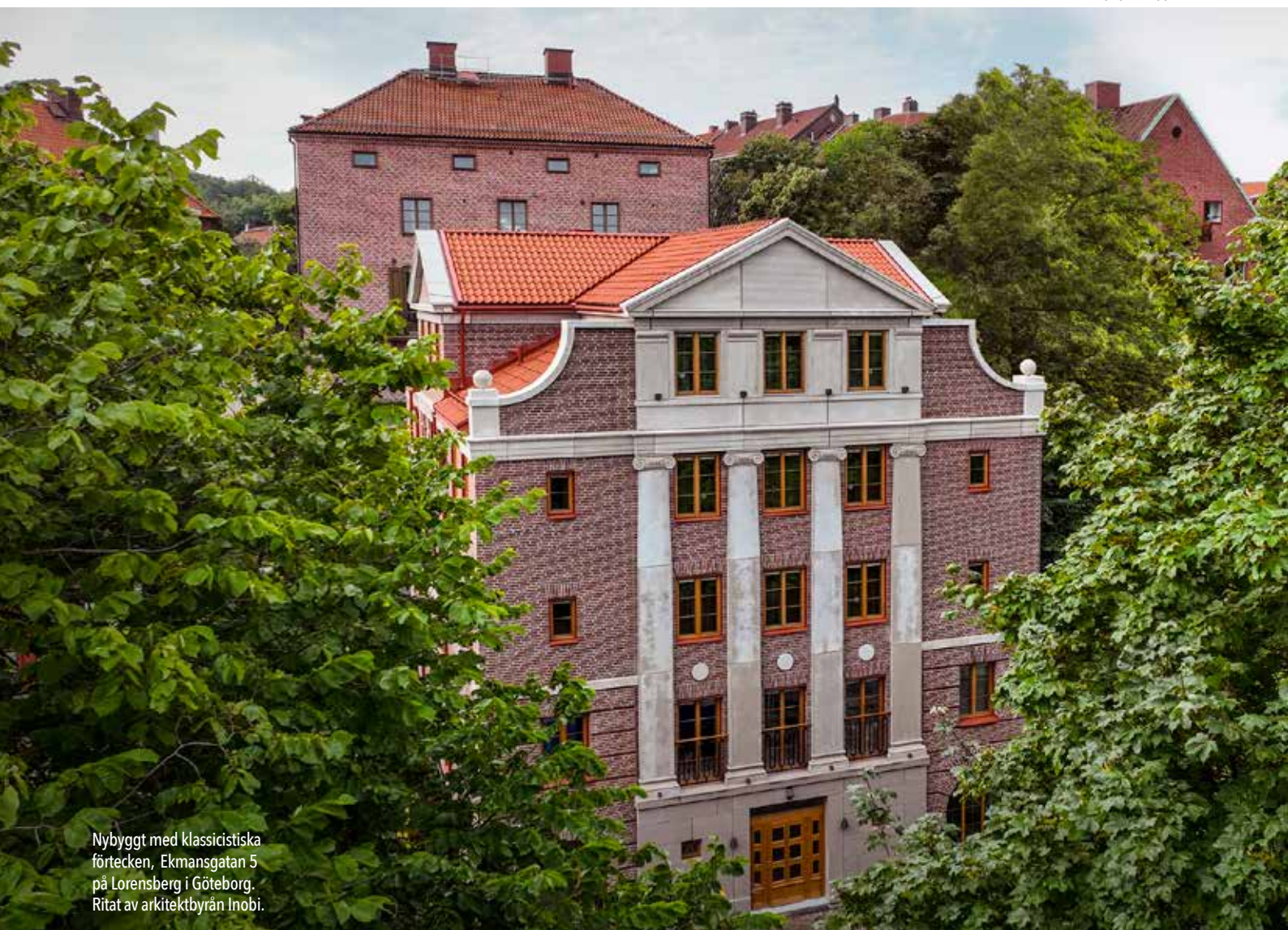
Nybyggt med klassicistiska förtecken, Ekmansgatan 5 på Lorensberg i Göteborg. Ritat av arkitektbyrån Inobi.