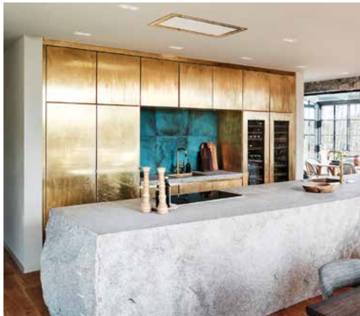
Rustikt och kompromisslöst.

Efter en bilresa längs en mindre och allt smalare grusväg någonstans i södra Sverige skulle ingen bli överraskad om man till slut kom fram till ett mindre övergivet torp där den röda falufärgen och den vita färgen på knutar och fönsterkarmar sedan länge flagnat, och där taket gapar med gluggar efter försvunna takpannor som någon storm lagt beslag på. Därför blir det plötsliga mötet med ett stort arkitekturritat och nybyggt rustikt stenhus närmast en uppenbarelse. Den mentala bilden av ett torp förbyts mot vad som närmast för tankarna till ett stenhus i den amerikanska Mellanvästern, beläget i ett slags pastoral idyll med sjötomt. Något man läser om i reportage om kända skådespelare från Hollywood som vill dra sig tillbaka till Montana för att få ro och avskildhet.