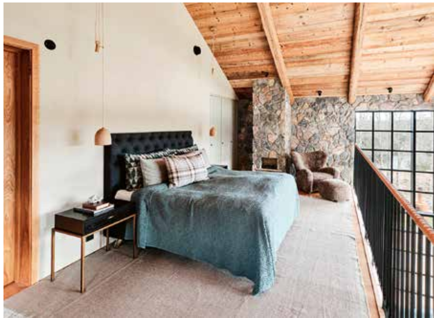
▲ Naturnära avskildhet.

verkat köksön medan Kungälv's Natursten har gjort håltagning och montering.