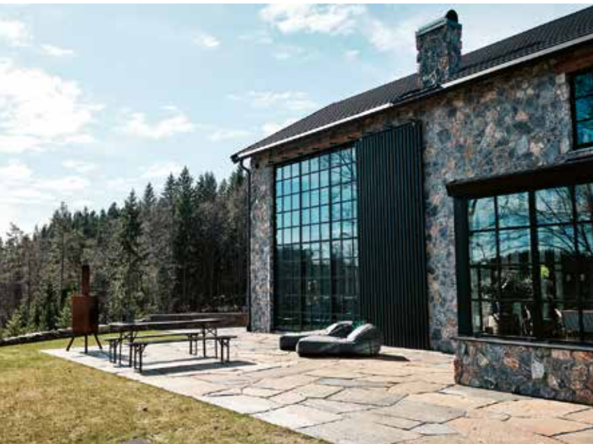
Stenen löser upp gränser mellan ute och inne.