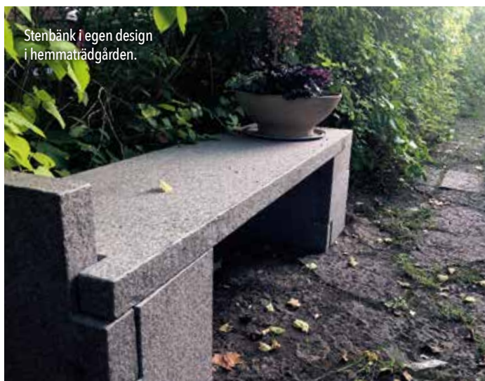
Stenbänk i egen design i hemmaträdgården.