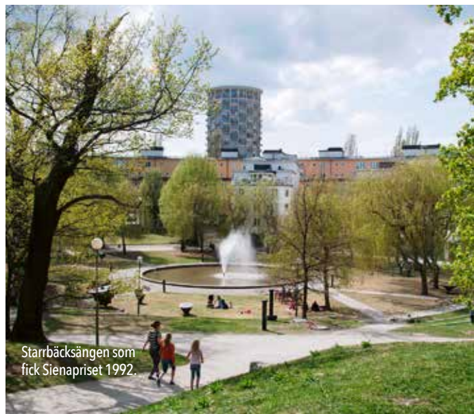
Starrbäckensängen som fick Sienapriset 1992.