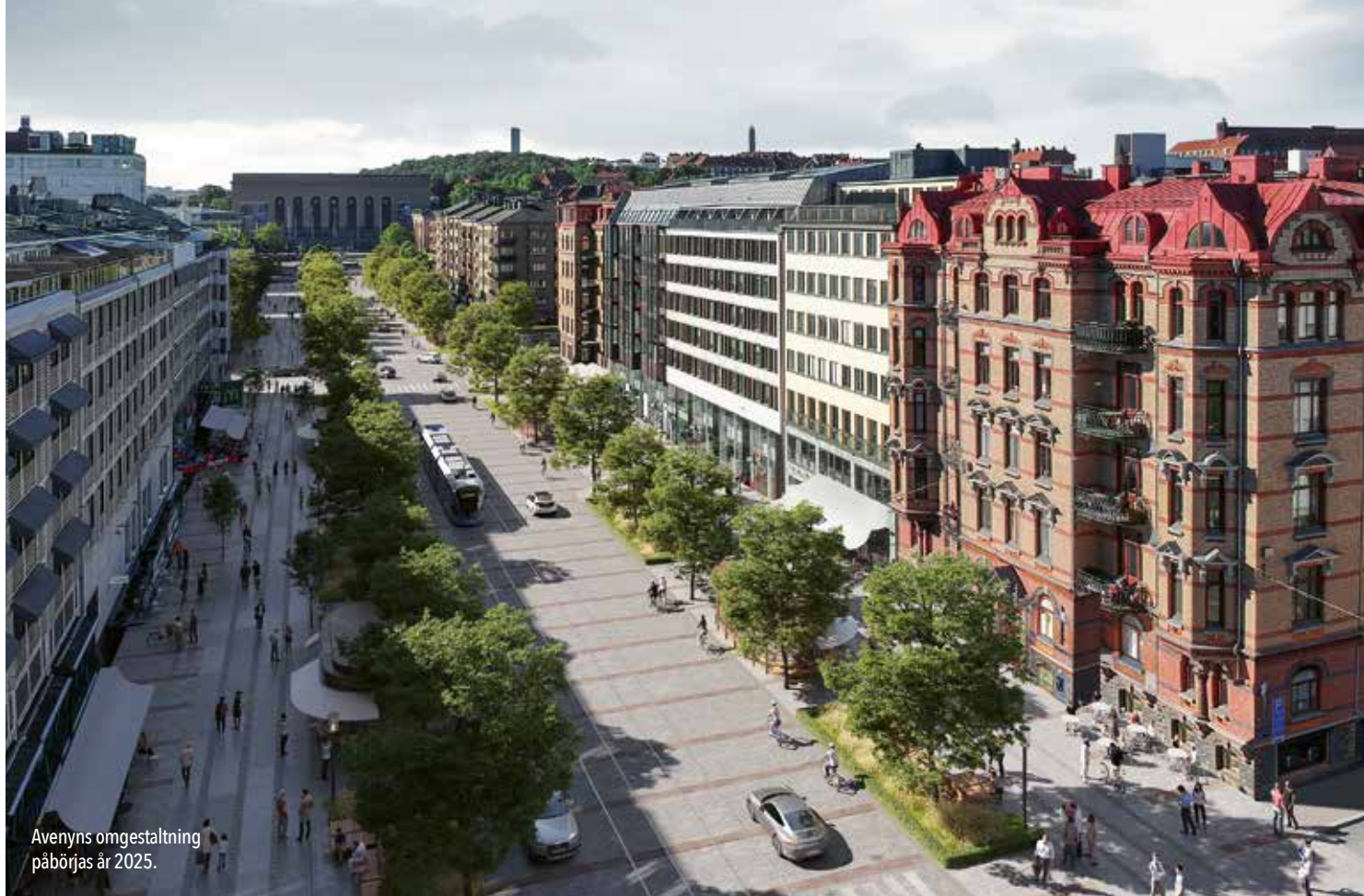
Avenyns omgestaltning påbörjas år 2025.