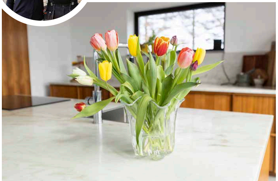
▲ Bänkskivorna i köket är av ljus Ekebergsmarmor.