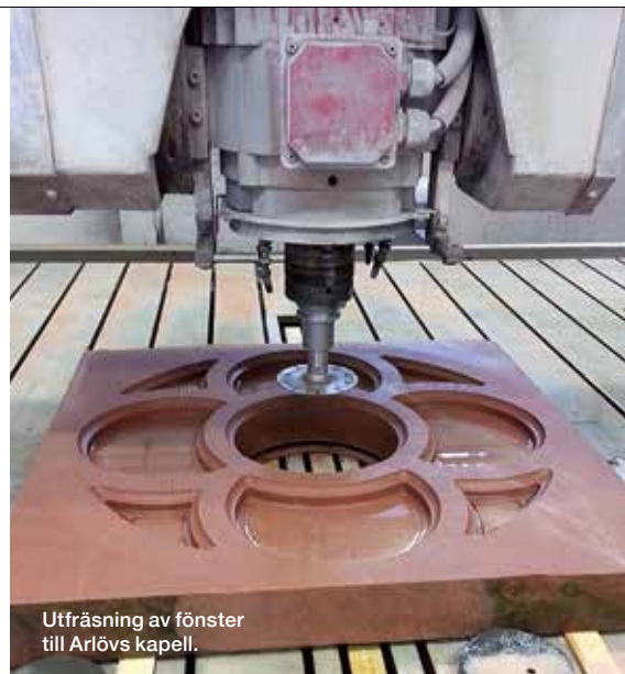
Utfräsning av fönster till Arlövs kapell.

Små och stora stendetaljer 3D-skanning, datormodulering