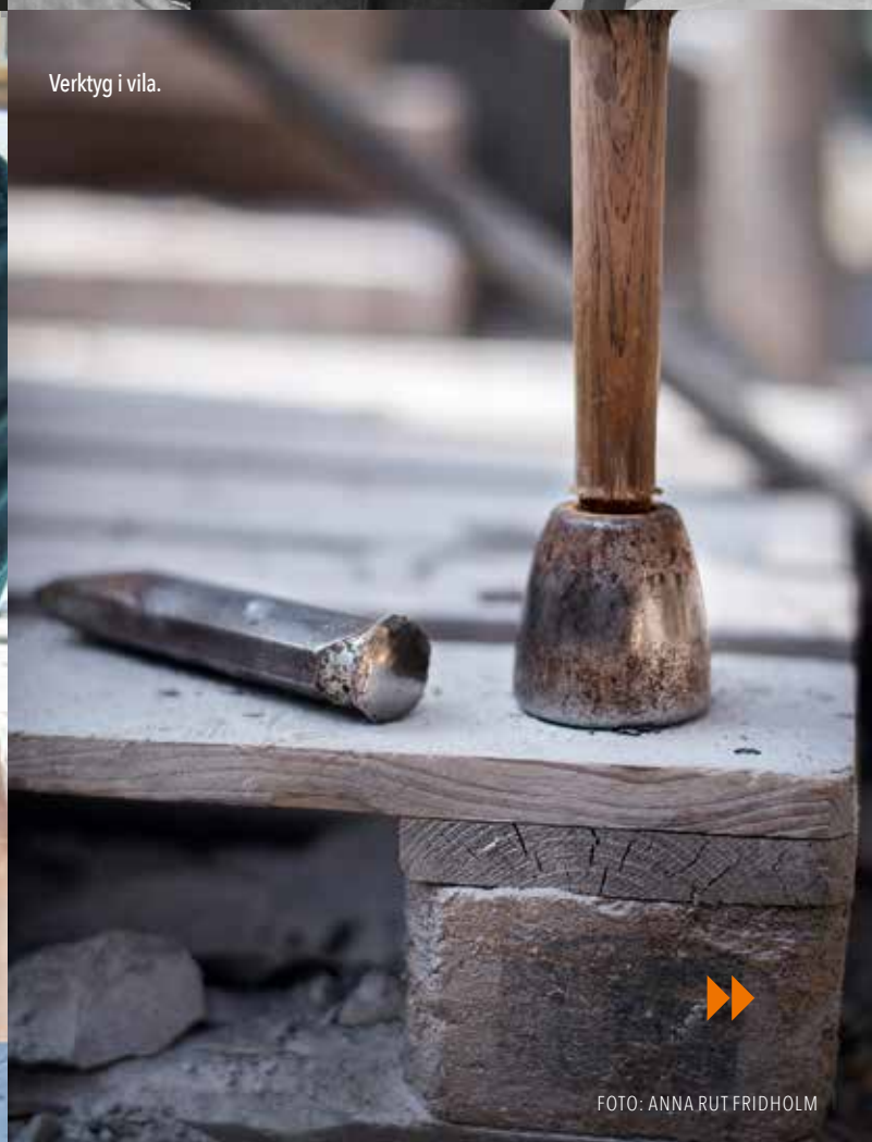
Verktyg i vila.