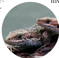
Skogsödlan är en av många fridlysta arter.

EU-domstolen i det uppmärksammade "Skydda skogen"-målet som meddelades i mars 2021. EU-domstolen underkände svensk rättspraxis avseende punkterna 1-3 i 4 § och påtalade att fridlysningen gäller på individnivå, inte populationsnivå. Viktigt att notera är att EU-