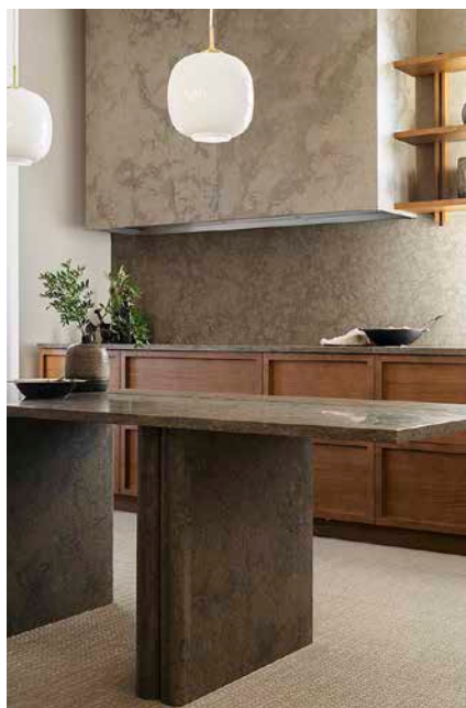
Kök med inredning i sten och trä från kökstillverkaren Kvänum.

– Vi vet sedan tidigare att klimatfrågan är mycket viktig för unga, och det finns en hög medvetenhet om alternativens för- och nackdelar. Det har säkert också en stor betydelse för valet av natursten, som ju är det material som har lägst klimatpåverkan och en lång livscykel.