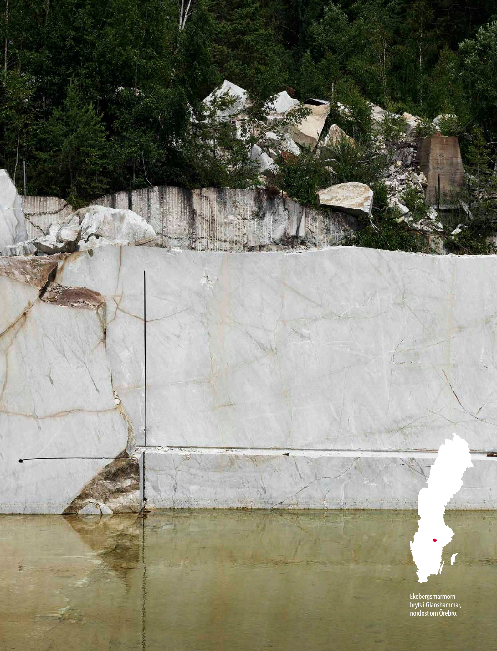
Ekebergsmarmor bryts i Glanshammar, nordost om Örebro.