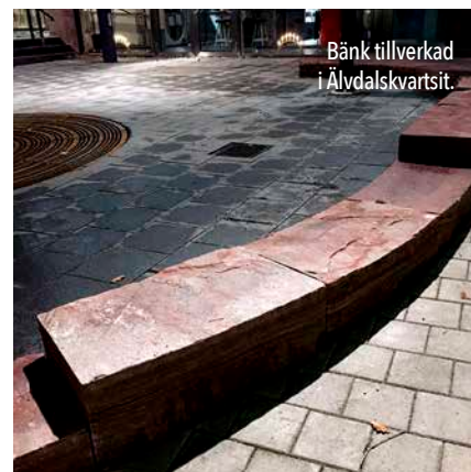
Bänk tillverkad i Älvdalskvartsit.