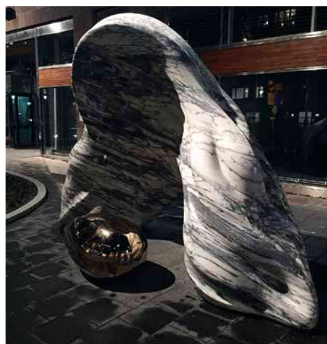
Samaneh Reyhanis skulptur Gowhar . Marmorblocket format till ett musselskal blottar en guldkimrande pärla, en symbol för demo- kratin som måste skyddas. Finns vid stadshusets norra entré, mot Vaksalagatan.