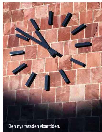
Den nya fasaden visar tiden.

Projekt: Uppsala stadshus. Beställare: Uppsala kommun. Arkitekt: Henning Larsen Architects. Stenleverantör: Wasasten. Stenentreprenör: Stenentreprenader i Hesselholm.