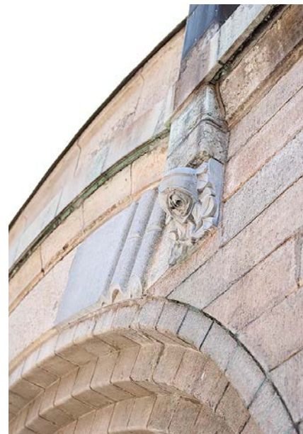
Detalj av valvbåge med skulptur där delar har bytts ut.