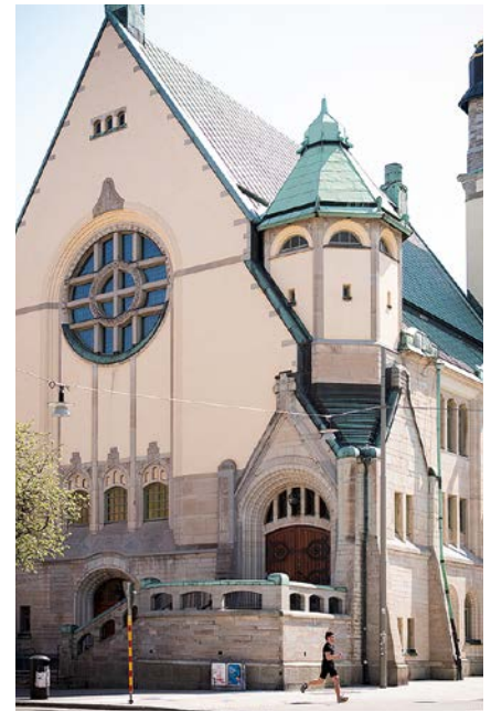
Vid uppförandet låg S:t Matteus i den tidens fattigkvarter, i dag är det ett av Stockholms mest attraktiva områden.

berg, vd för Kyrkans Fastighetssamverkan, KFS.