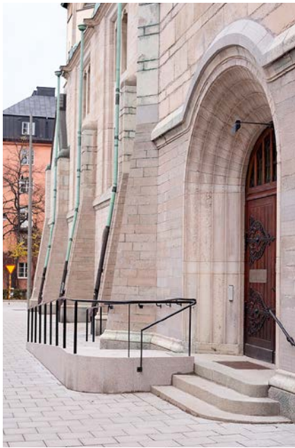
Tillgänglighetsanpassning med ny granitramp vid entrén mot Dalagatan.