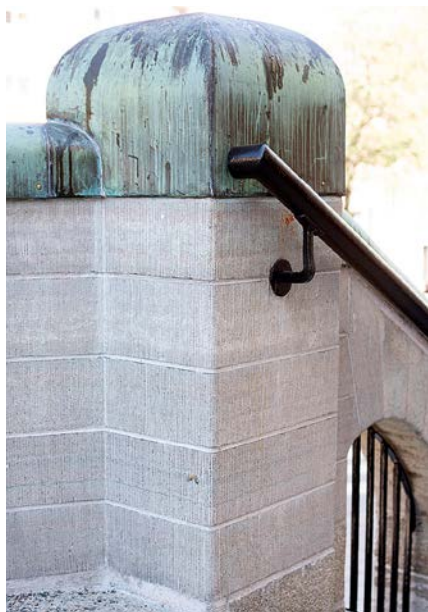
Detalj från stentrappan till den stora entrén, som plockades ned helt och sedan monterades på nytt.