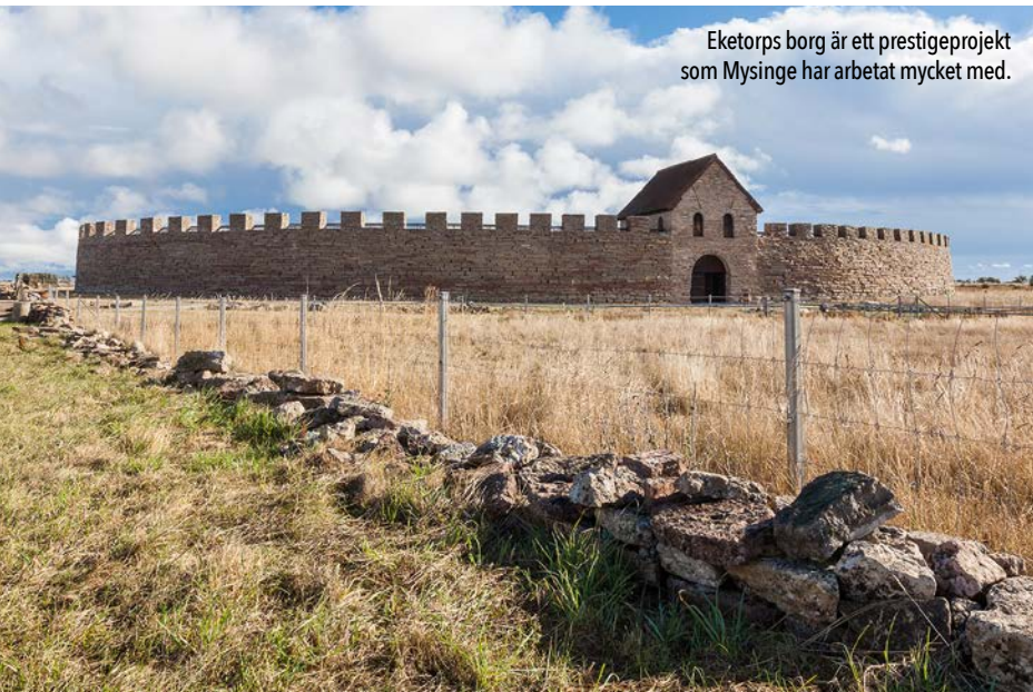
Eketorps borg är ett prestigeprojekt som Mysinge har arbetat mycket med.