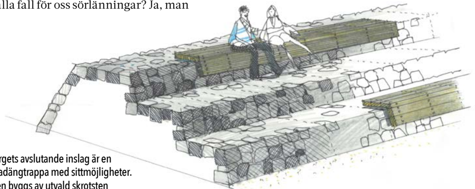
Torget avslutande inslag är en gradängtrappa med sittmöjligheter. Den byggs av utvald skrotsten från ortens malmbrytning.

ATT ARBETA MED ett offentligt rum så här långt norrut är ovant för de flesta av oss. Det ger möjligheter att åstadkomma något alldeles speciellt. När vi har valt växter har vi letat på ryska och finska plantskolor. Det finns ett betydligt vidare sortiment än gran, tall, björk och tall som klarar sig här men odlingstraditionen är inte lika utbredd som längre söderöver. På en liten ort belägen med fjällterräng nära finns det inte heller en stark tradition i att vistas och träffas på offentliga platser i stadsmiljö. Det steget tar nu Gällivare. ■