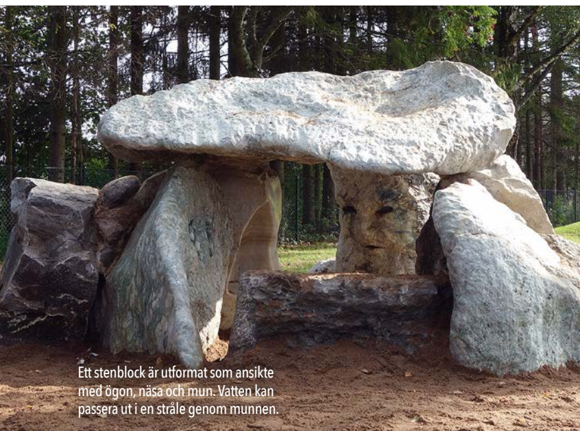
Ett stenblock är utformat som ansikte med ögon, näsa och mun. Vatten kan passera ut i en stråle genom munnen.