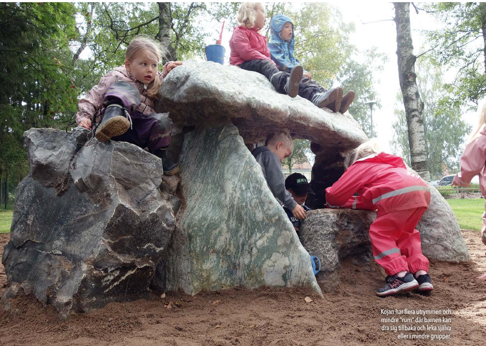
Kojan har flera utrymmen och mindre "rum" där barnen kan dra sig tillbaka och leka själva eller i mindre grupper.