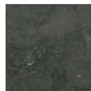
Grå Jämtlandskalksten, polerad.

Vanliga ytbearbetningar: Normalslipad, finslipad, hyvlad, antikbehandlad, flammad, huggen och polerad.