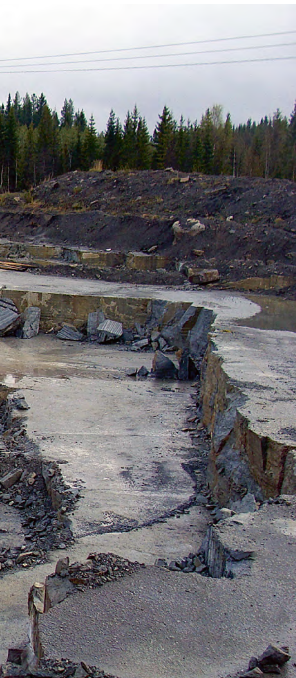
◀ Jämtlandskalkstenen som bryts i Grytan finns i fyra varianter – grå, röd, svart och exklusiv.

– Jag har aldrig hört talas om någon som haft problem med Jämtlandskalksten i till exempel ett badrum, säger han. ■