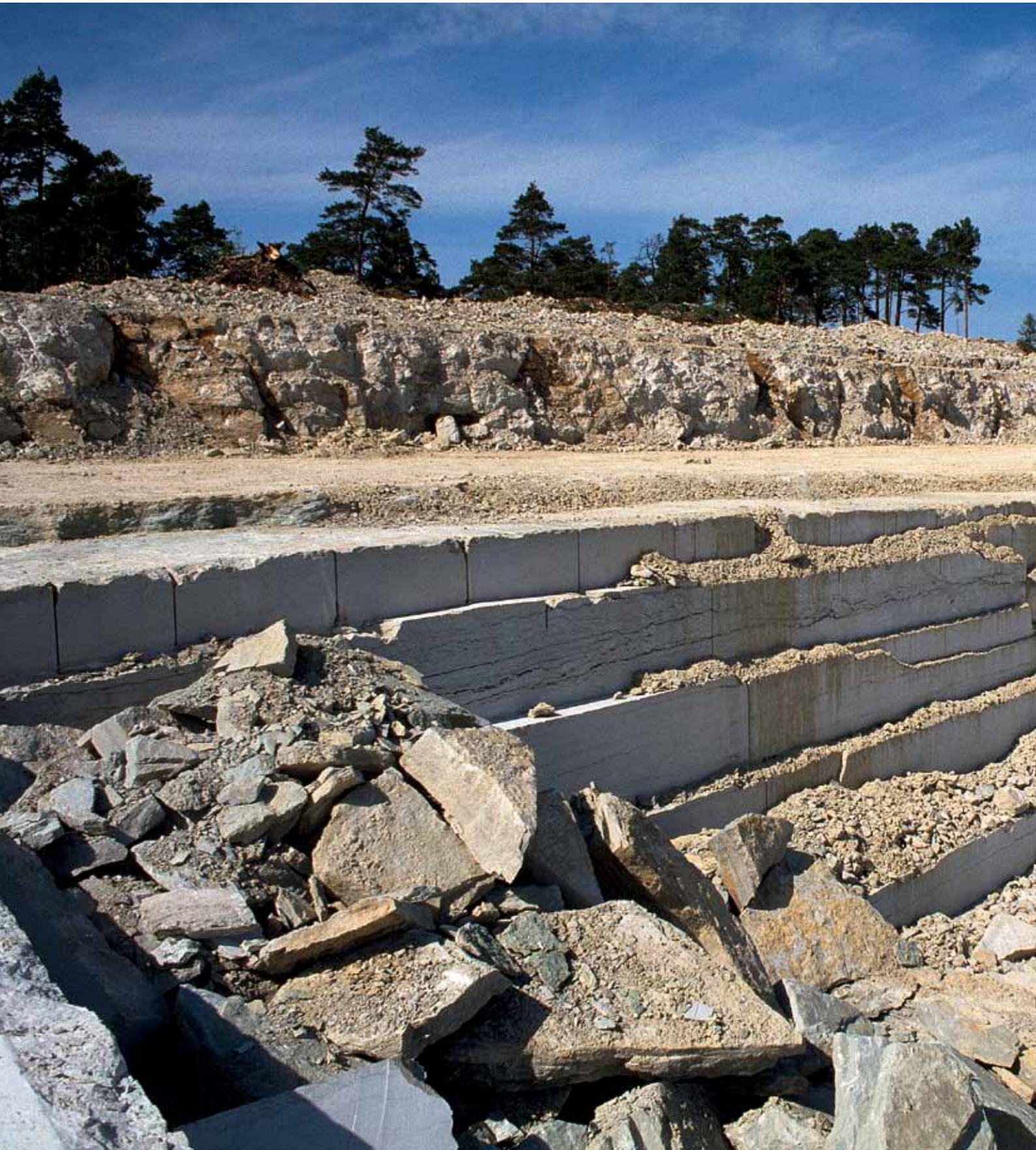
TEXT PETER WILLEBRAND