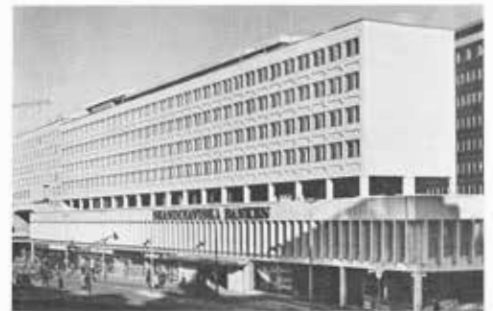
□ Fasaderna med Sergels torg.