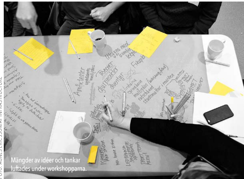
Mängder av idéer och tankar luftades under workshopparna.

- Det var modigt av Malmö stad att välja vårt förslag. Det är inte bara att köpa det rakt av, utan det krävs ett långsiktigt engagemang, säger Emma B Jones.