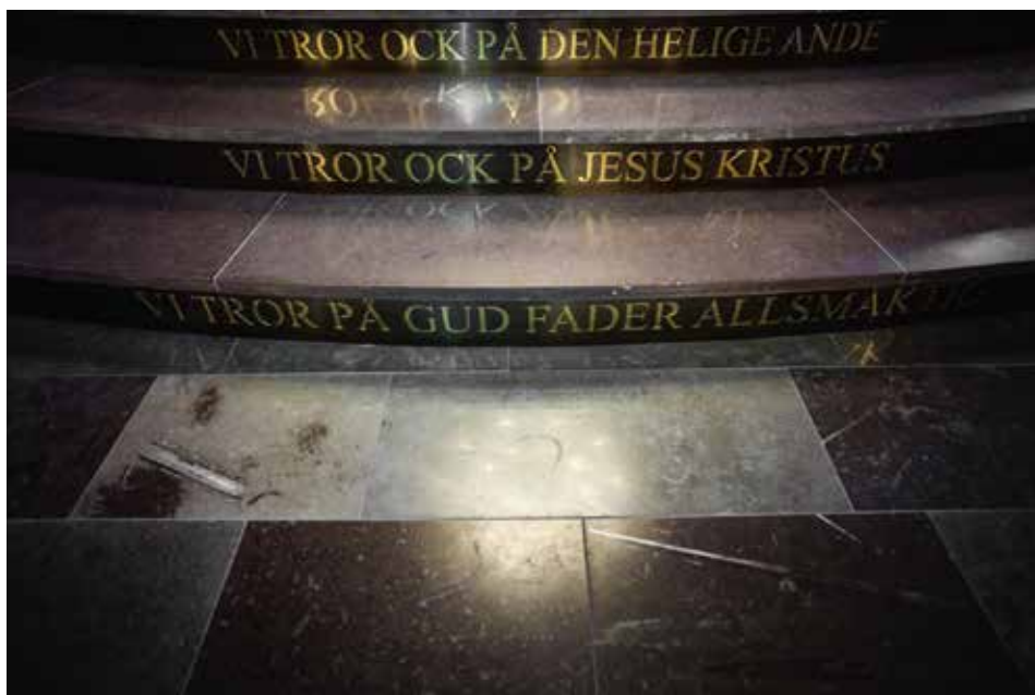
Den mustiga, rödflammiga Ölandsstenen förstärker rummets helhet.

Det är en 20 millimeter tjock beklädnad av den vittrade tegelsockeln som "gräver" sig ner i marken. De gerade hörnen var ingen lyckad byggtknisk lösning. En reparation av det gamla tegelmurverket var på sikt bättre.