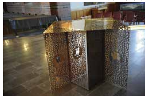
Altarbordet i brons har uppfällbara vingar dekorerade med evangelistsymboler och altarkors.

"En fruktbar dialog har odlat fram ett kyrkorum i samspel med historien, som fungerar och är älskat."