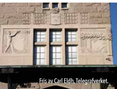
Fräs av Carl Eldh, Telegrafverket.