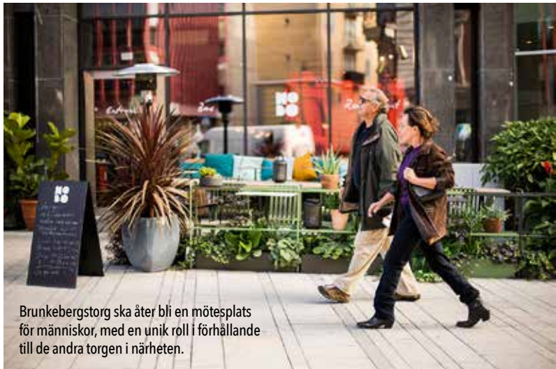
Brunkebergstorg ska åter bli en mötesplats för människor, med en unik roll i förhållande till de andra torgen i närheten.