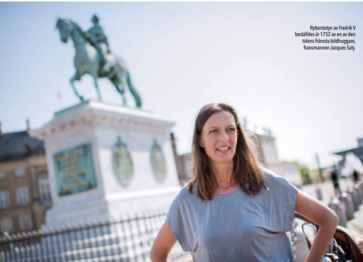
Ryttarstatyn av Fredrik V beställdes år 1752 av en av den tidens främsta bildhuggare, fransmannen Jacques Saly.

F ru Sten väntar vid Fredrik V:s ryttarstaty på Amalienborgs slott i Köpenhamn. Marmorpedestalen glänser i solen. Det är sommar, turisterna strömmar förbi med kameror, resehandböcker, mobiler. Stadens rörelse i alla plan: bilar och cyklar susar förbi, folk har bråttom till jobbet. Även stenen omkring oss, stadens ansikte och fundament, har sin pågående, långsamma förändring.