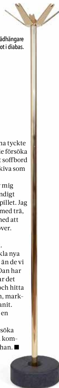
Klädhängare med fot i diabas.

– Det skulle vara roligt att försöka utveckla något som kan fungera kommersiellt i en större skala, säger han. ■