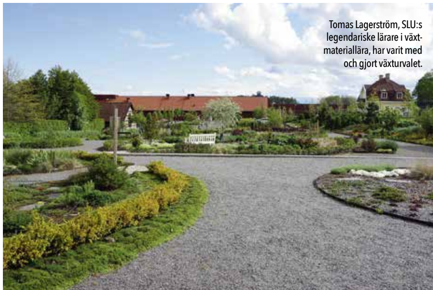
Tomas Lagerström, SLU:s legendariske lärare i växtmateriallära, har varit med och gjort växturvalet.

”Trädgården är mer öppen, solig och består av ett antal cirkelrunda bersåer ställda på en botten av grus. Den är lite mera lekfull än den stramare staden.”