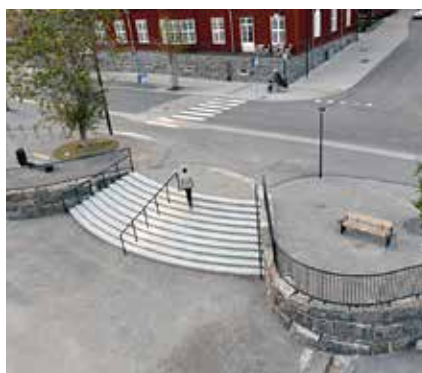
▲ Svängd trappa i måttbestämd Gotlandskalksten. Fin fotoplats för en avgångsklass. Trappräcket har infälld belysning. Till vänster en sparad poppel.