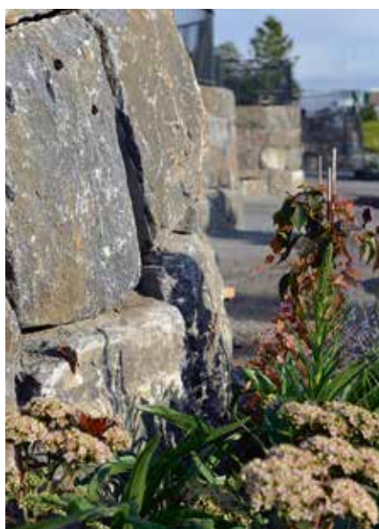
▲ Insekter och fjärilar trivs i det varma, vindstilla klimatet vid muren och perennerna. Där kan de finna boplatser i skarvarna. Stensättarna har lagt stor möda på att välja ut och placera de gamla kajstenarna.