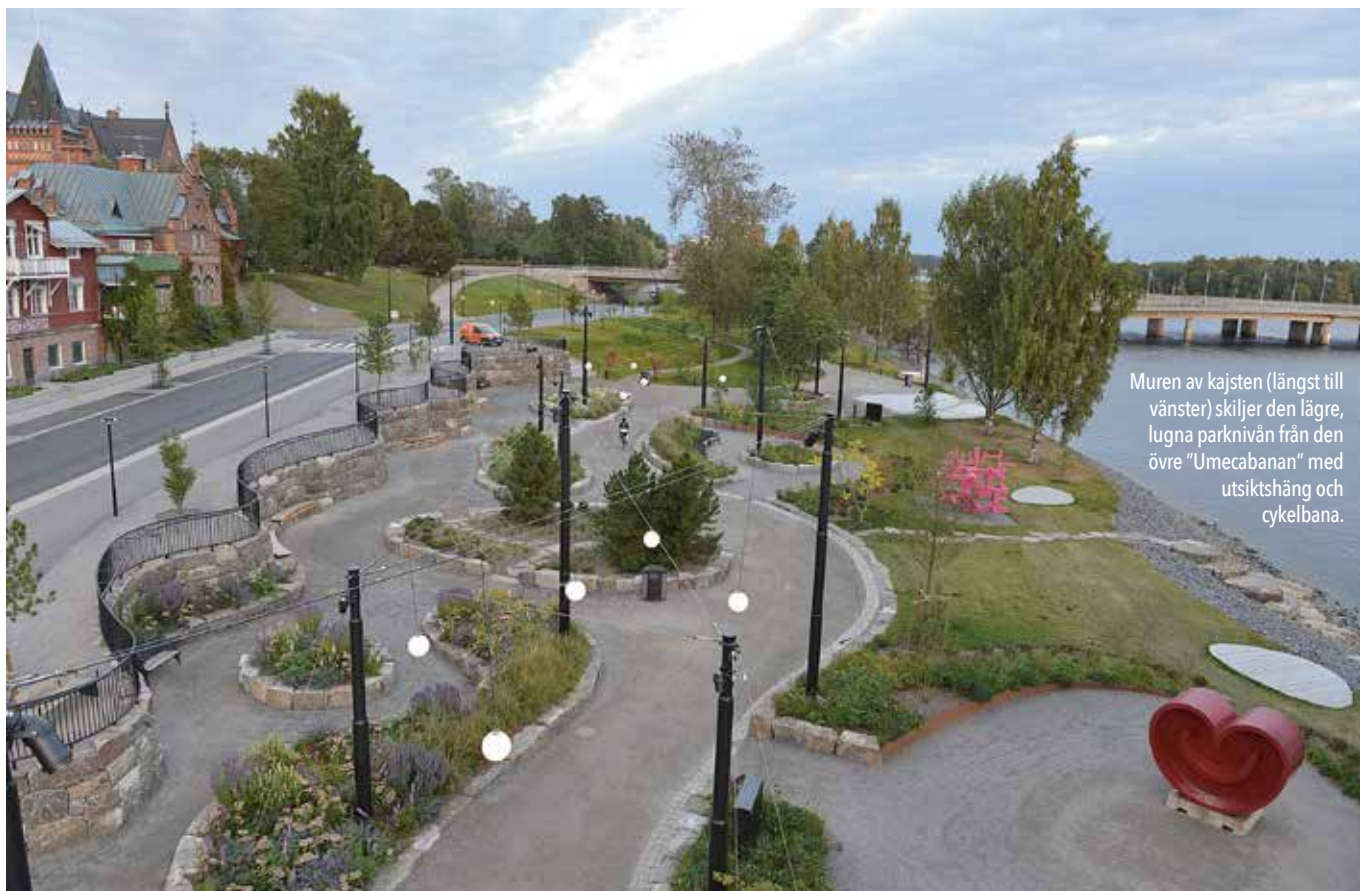
Muren av kajsten (längst till vänster) skiljer den lägre, lugna parknivån från den övre "Umecabanan" med utsiktshäng och cykelbana.