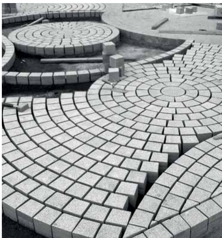
▶ Ritningens mønster tar virkelig form.