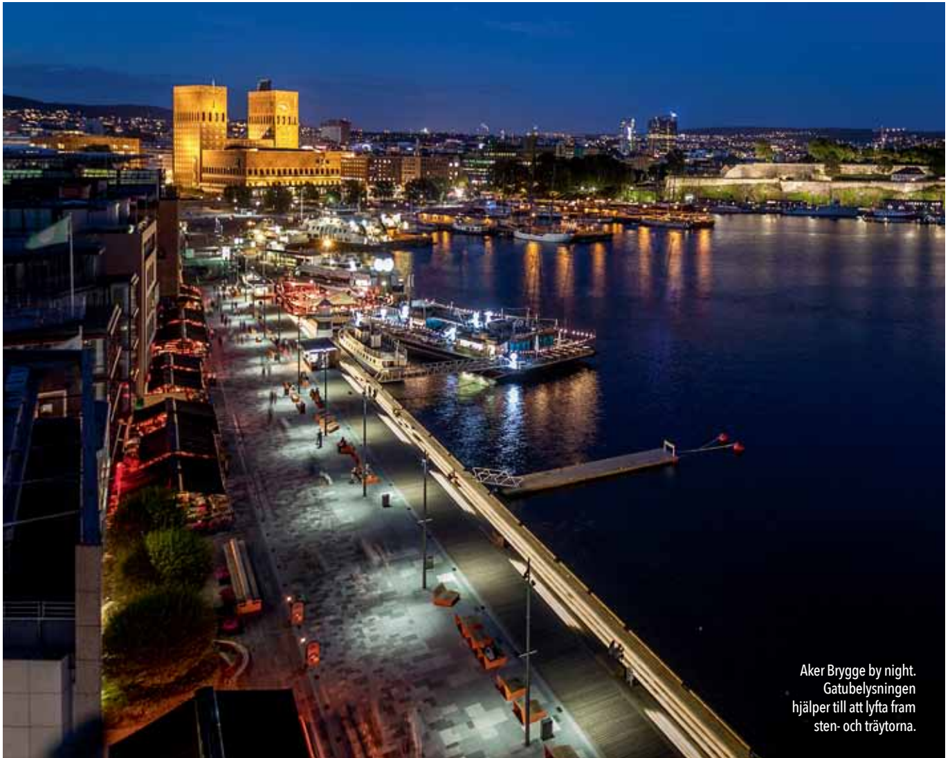
Aker Brygge by night. Gatubelysningen hjälper till att lyfta fram sten- och träytorna.

”Beläggningsen är lagd i moduler, där det ingår plattor i granit av olika storlek, färg och bearbetning. Sammansättningen är medvetet skapad för att ge en känsla av oregelbundenhet.”