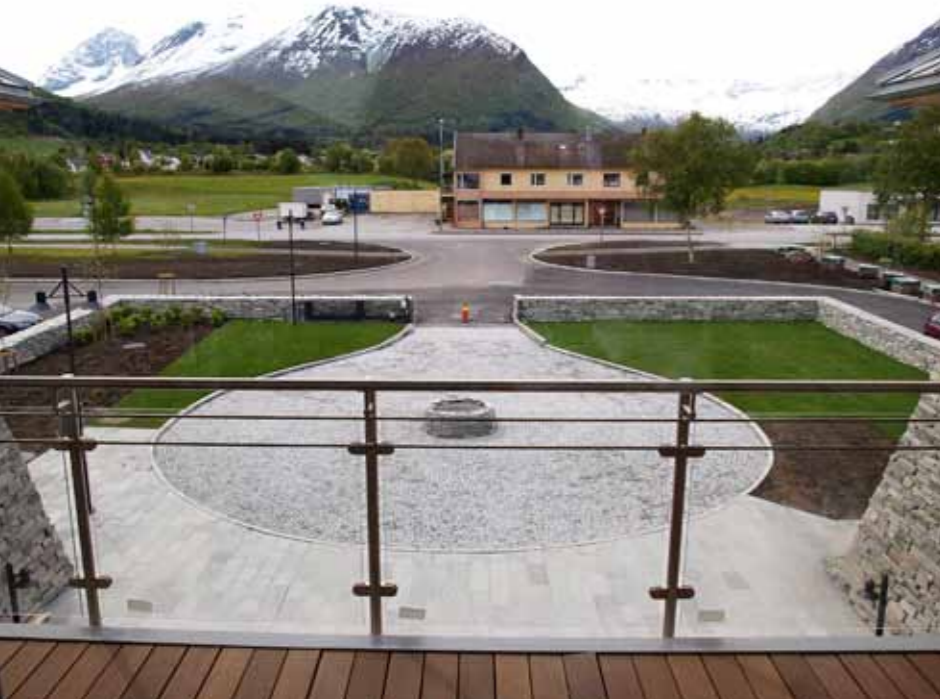
Utsyn over inngangspartiet, med gatesten og skifer.