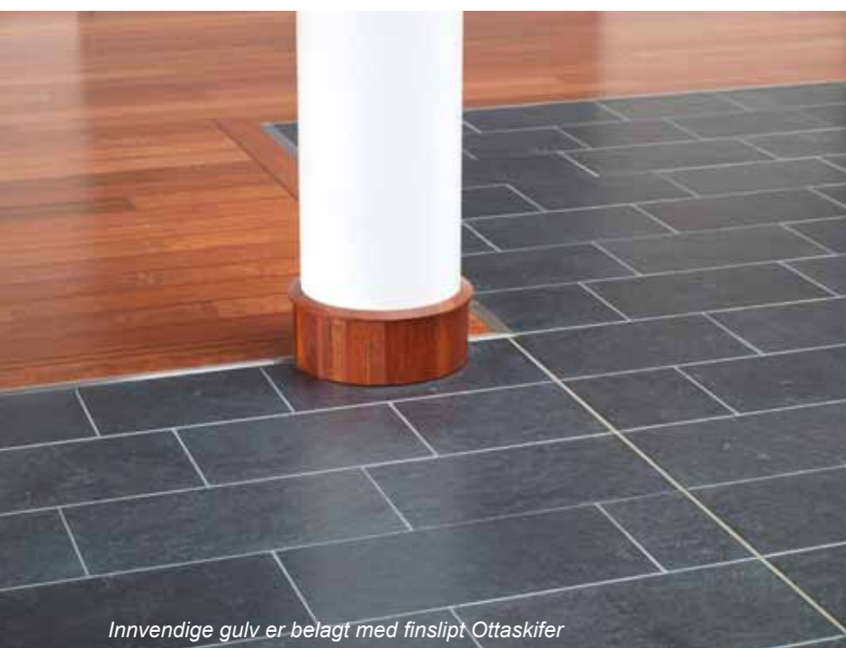
Innvendige gulv er belagt med finslipt Ottaskifer

M åndalen ligger i en bygd i Rauma kommune i Møre og Romsdal. Bygden har omlag 900 innbyggere og er sentret på sørsiden av Romsdalsfjorden.