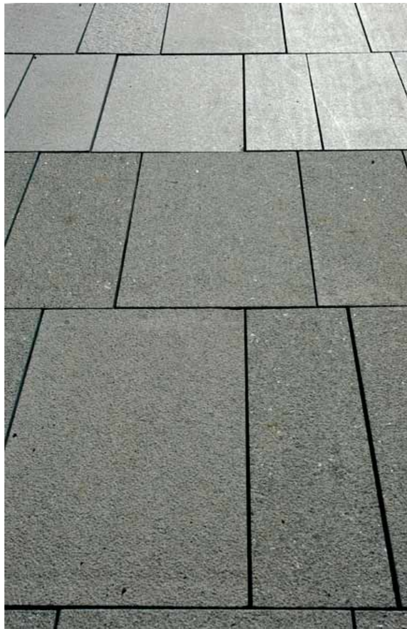
Forskellen på den jetbrændte og slebne granit giver stor effekt.