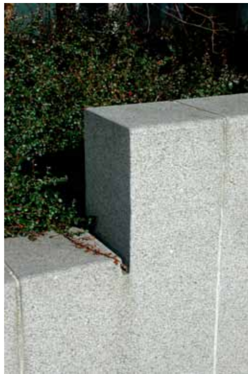
Eksempel på granittens anvendelse i en naboejendom.

"Projektet er meget svært at komme udenom. Det har en kunstnerisk kraft og står som en knivsæg på hjørnet som en yderst overbevisende stævn. Atmosfæren inde i kontorerne er blød, rar og varm - overbevisende og af meget høj kvalitet. Bygningen er fyldt med skandinavisk sensualitet. Den står rigtigt på jorden og linjerne er samlet op i grundplanen. Opleves som en af de mest spændende bygninger i området."