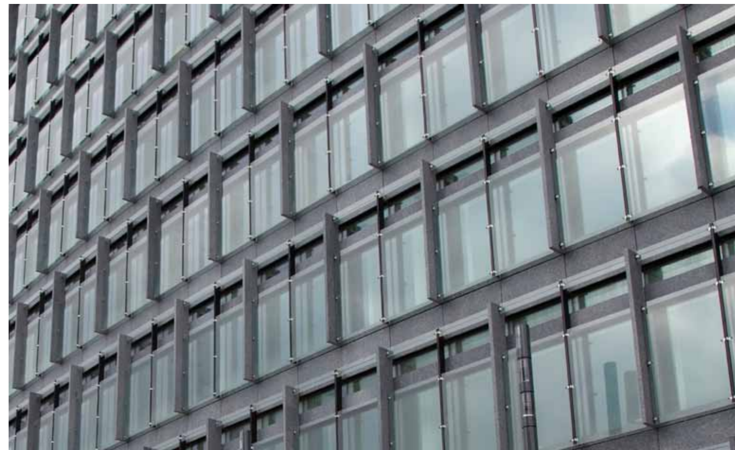
De slanke granitfiner, der er en del af solafskærmningen, giver facaden dybde.