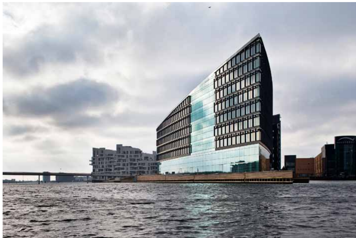
Det nye multimediehus ligger på spidsen af Havneholmen, omgivet af vand på to sider.